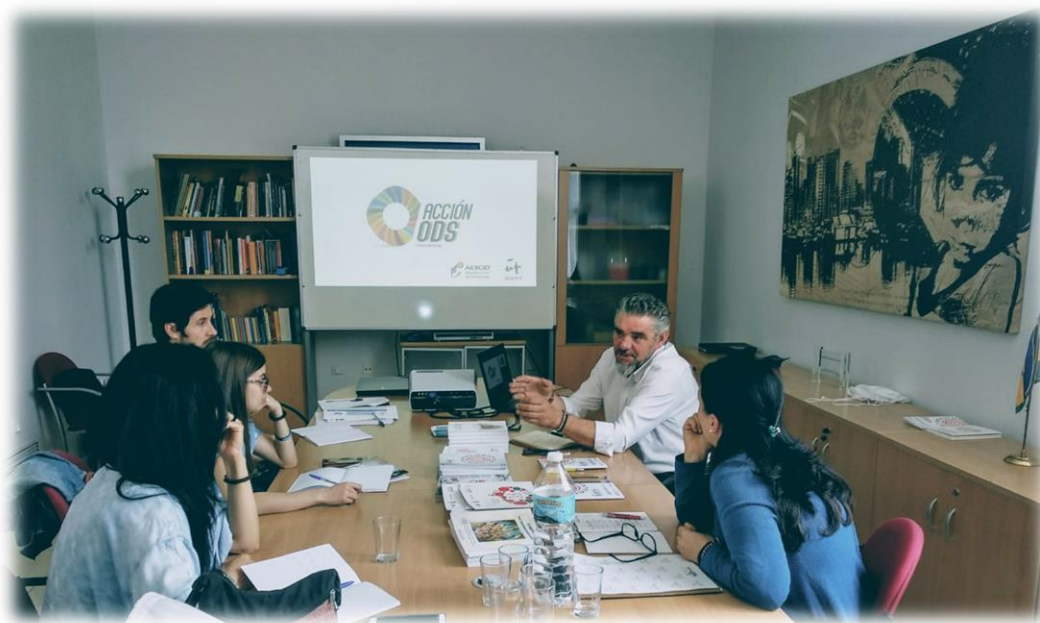
Las directoras de las UP conversan con el Área de Cooperación.